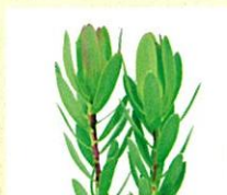
コアラブラッシュ