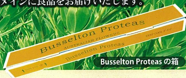
Busselton Proteas の箱