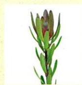
サファリサンセット