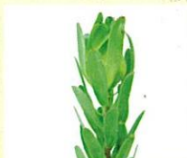
グリーンデラックス