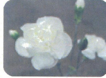
ホホワイトフルーレット