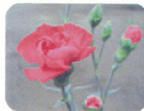
ローズキャンドル