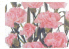
ライトピンクバーバラ