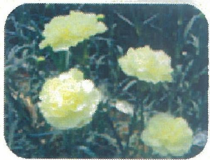
ガンジーイエロー